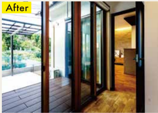
▲洗濯物の干し場としてはもちろん、子どもたちの遊び場やBBQスペースとしても活用できるウッドデッキを設置。耐久性の高い樹脂製を採用しています

▼日当たりも見晴らしもよい南側の和室。家の中で最もいい場所を選んで作られていた客間でしたが、うまく活用できていませんでした