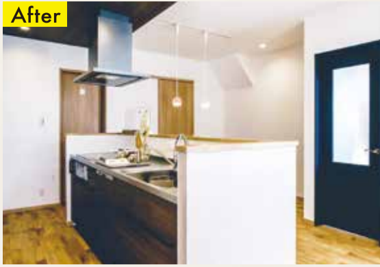
▲キッチン大きく場所を変えて、壁付きから対面キッチンに変更。LDKに続くウッドデッキで遊ぶ子どもや、奥の子ども部屋まで見渡せるので安心