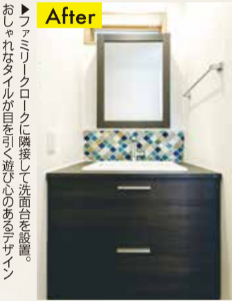
▶ファミリークロークに隣接して洗面台を設置。おしゃれなタイルが目を引き遊び心のあるデザイン