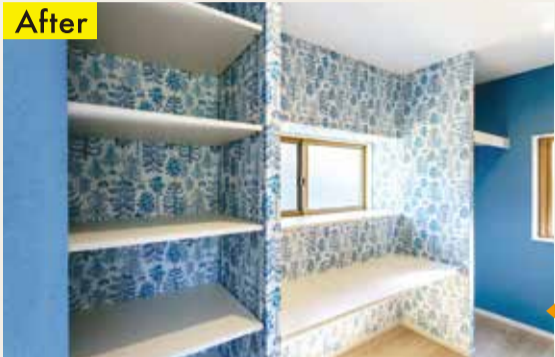
▲キッチンだった場所が大容量のファミリークロークに変身。家族みんなの靴や衣類が集約できます。玄関からシューズ・ファミリークローク、洗面台へと通り抜けられるようになっており、生活動線も◎