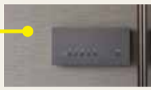
▲リビングライコンもLDKの雰囲気に調和するマットなグレー色を選択

◀6パターンの照明をワンタッチで切り替えられるリビングライコンを設置。TVを見ながらくつろいだり、お酒を堪能したりと、シーンに応じて光の演出を楽しんでいます